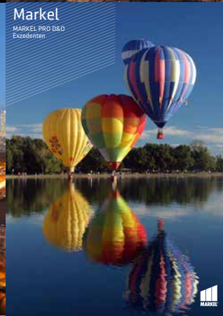
Markel MARKEL PRO D&D Ezedenenten