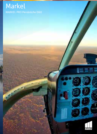
Markel MARKEL PRO Persönliche D&D