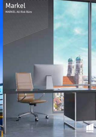
Markel MARKEL ALL Risk Büro