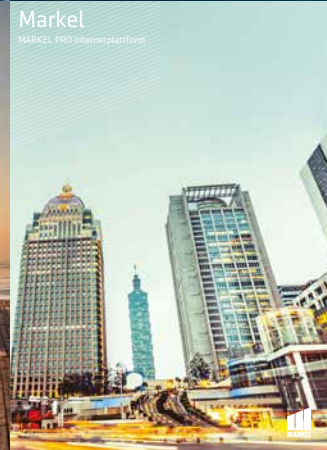
Markel MARKEL PRO Internetplattform