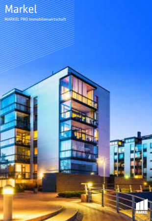
Markel MARKEL PRO Immobilienwirtschaft