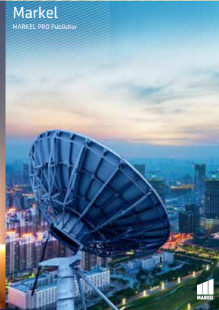
Markel MARKEL PRO Publisher