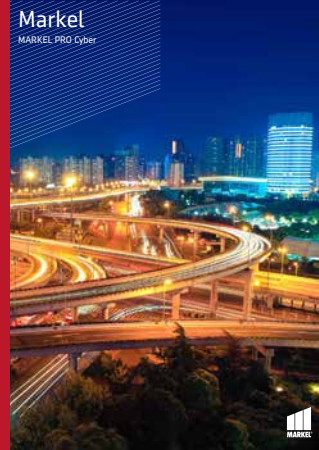
Markel MARKEL PRO Cyber