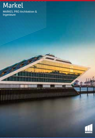
Markel MARKEL PRO Architekten & Ingenieure