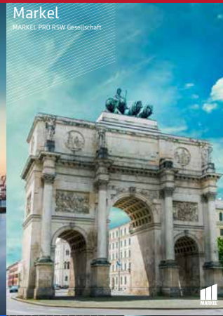
Markel MARKEL PRO RSW Gesellschaft