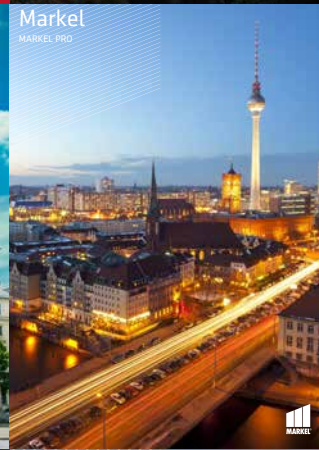
Markel MARKEL PRO