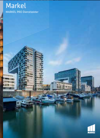
Markel MARKEL PRO Dienstleister