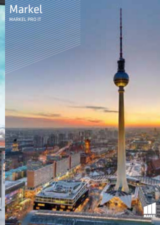
Markel MARKEL PRO IT