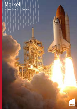
Markel MARKEL PRO D&D Startup