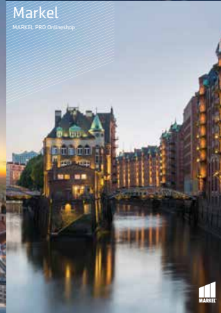
Markel MARKEL PRO OnlineShop