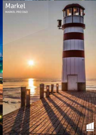
Markel MARKEL PRO D&D