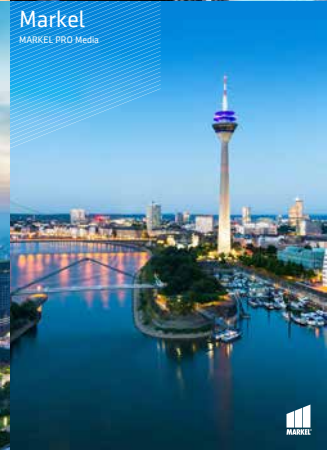
Markel MARKEL PRO Media